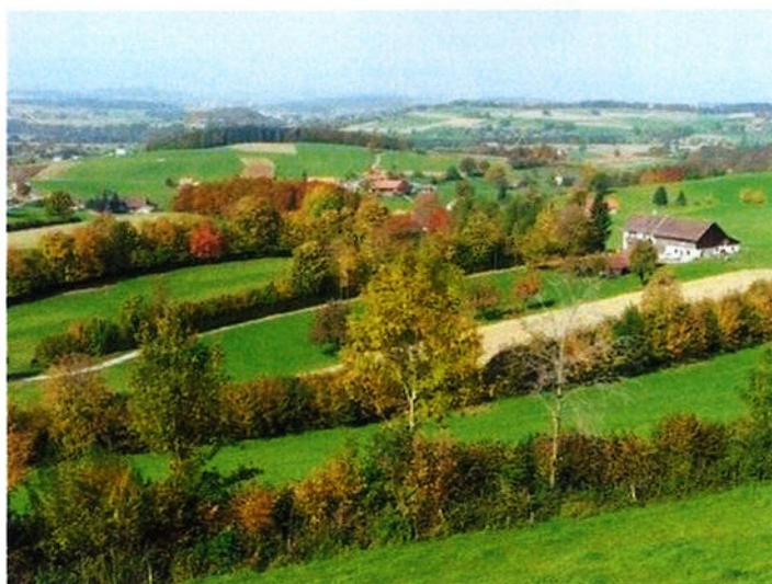
A gauche, allée d'arbres ; à droite, haies