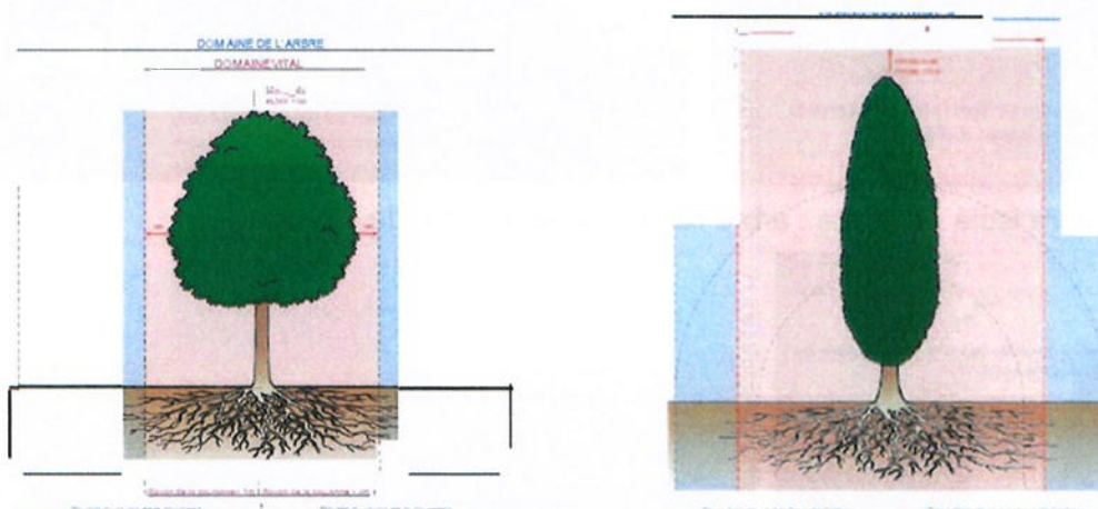
Illustration du domaine de l'arbre et de son domaine vital 4

2 La protection des éléments individuels s'étend aussi à leur domaine vital correspondant à la zone d'extension de leurs racines.