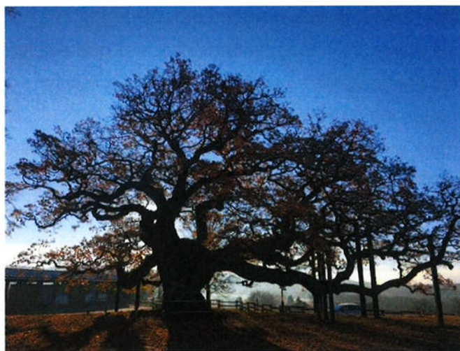
A gauche, arbre isolé ; à droite : arbre remarquable (chêne de Morrens)