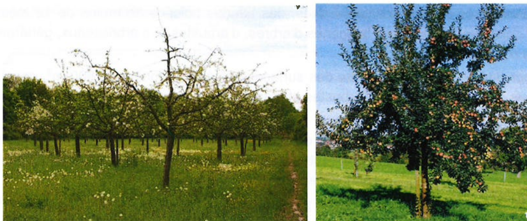
A gauche, verger ; à droite, arbre fruitier haute tige